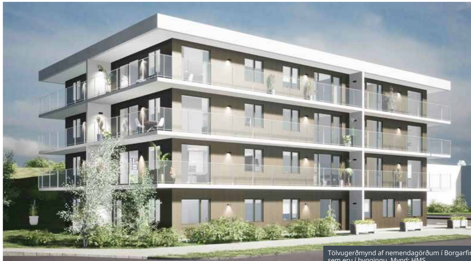
Tölvugerðmynd af nemendagörðum í Borgarfirði sem eru í byggingu.

Við sjáum mikil samlegðaráhrif í því að FAS og háskólasetrið taki höndum saman um að hefja umræðu um byggingu nemendagarða hér á Hornafirði.