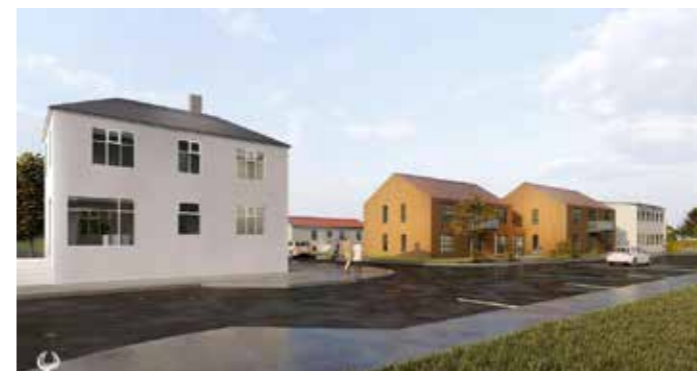
Tölvugerðarmyndir af nemendagörðum fyrir Lýðskólan á Flateyri. Myndir: Yrki arkitektar

Bygging nemendagarða er því gríðarmikið framfaramál fyrir FAS og háskólastarfið hér á Höfn.