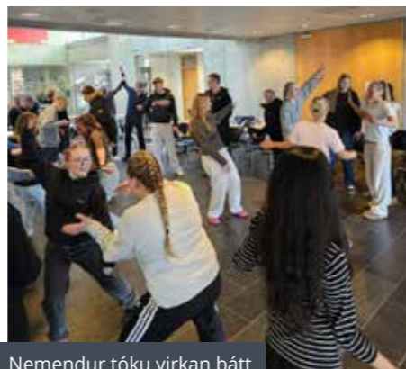
Nemendur tóku virkan þátt

Í hádegishléi var boðið uppá grillaða hamborgara og gafst þá tækifæri til að ræða sín á milli upplifun af æfingum og verkefnum námskeiðsins. Nemendur höfðu sumir á orði að þetta hefði á köflum verið „það steiktasta og jafnvel óþægilegasta sem þau hefðu gert“. Þau sögðu þó einnig að þetta hefði verið mjög skemmtilegt og þau lært mikið af upplifuninni enda hefðu þau þurft að