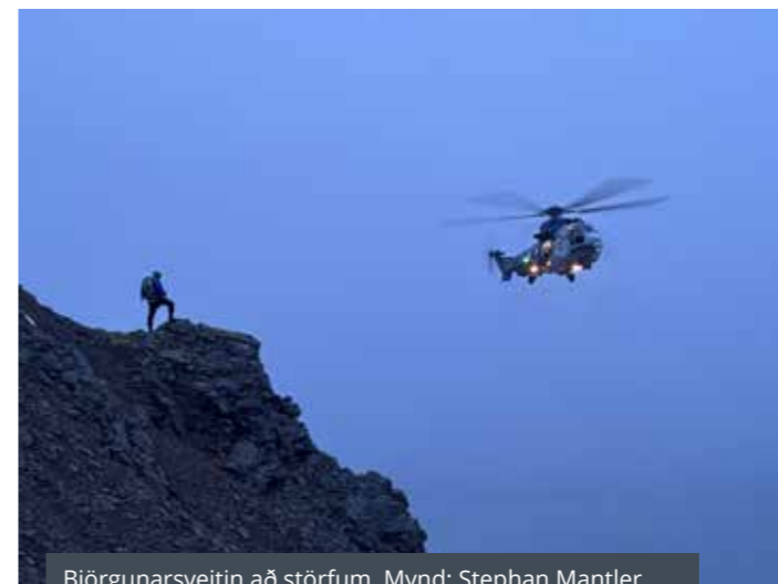
Björgunarsveitin að störfum.