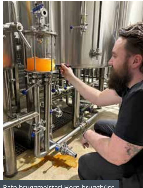
Rafn brugghúsi Horn brugghúss

Brugghúsið og veitingastaðurinn á Heppu vinna mjög náið saman. Bjórnir eru þróaðir með það í huga að passa með matnum sem við bjóðum upp á og maturinn gerður til þess að passa með bjórnum. Gestir fá þannig ferskan bjór beint úr brugghúsinu og þannig lyftum við upplifuninni á aðeins hærra plan. Þrátt