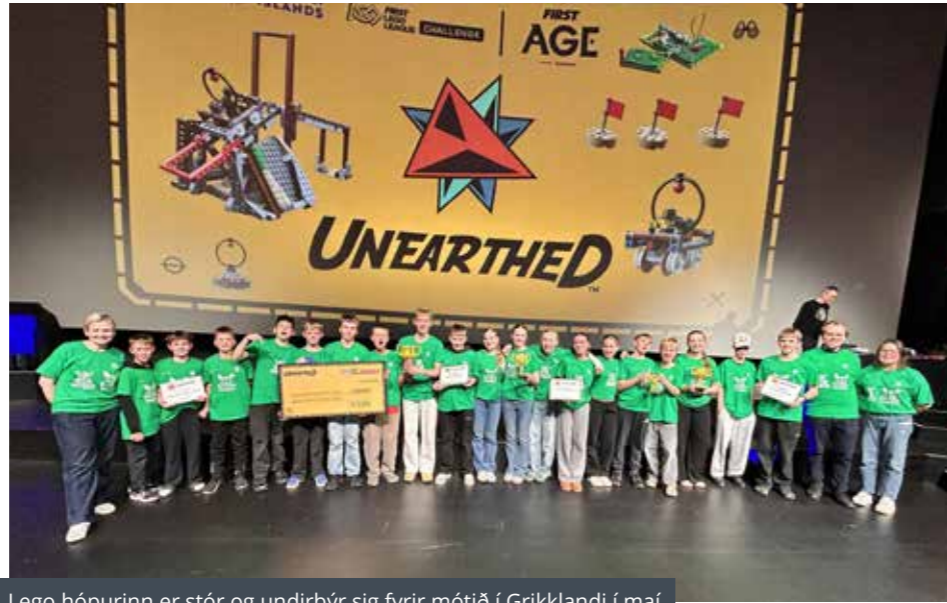
Lego hópurinn er stór og undirbýr sig fyrir mótið í Grikklandi í maí

Eftir mikla vinnu uppskáru liðin vel, en saman deildu liðin 1. sæti í vélmennakappleik, Berserkir lenti í 1. sæti í liðsheid og Fortíðakubbar lentu í 3. sæti fyrir besta nýsköpunarverkefnið. Að lokum