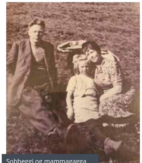
Sobbeggi og mammagagga

Sálmurinn um blómið er kjörinn til samlesturs barna og fullorðinna þar sem heimur barnsins og ólíkar sjálfsmyndir lærimestarans Þórbergs kallast á. Sálmurinn um blómið er því bók fyrir börn á öllum aldri.