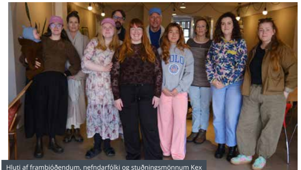
Hluti af frambjóðendum, nefndarfólki og stuðningsmönnum Kex

Við bjóðum okkur fram til áframhaldandi verka og öflugrar hagsmunagæslu fyrir sveitarfélagið. Setjum X við Kex 16. maí 2026.