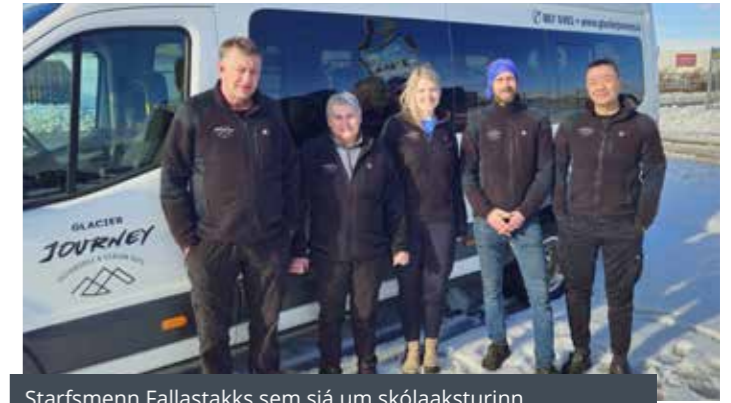
Starfsmenn Fallastakks sem sjá um skólaaksturinn

Fara þarf snemma af stað og veður og færð geta oft gert erfitt fyrir, en ef vegir haldast opnir gengur bíllinn eins og klukka. Bílstjórnarnir mynda oft góð tengsl við krakkana. Nú fer að líða að páskum og er venja hjá einhverjum fyrirtækjum að gefa starfsmönnum sínum gómsæt páskaegg. Skólabíllinn gerði gott betur og sýnir það umhyggju þeirra gagnvart börnunum sem þau keyra á milli dags daglega. Á mínu heimili er eitt barn komið á aldur til þess að nýta sér skólabíllinn en innan nokkurra ára verða þau þrjú. Dóttir mín kemur heim einn daginn með páskaegg frá skólabílnum, ekki einungis handa sér heldur einnig handa systkinum sínum. Hugulosemin, fagmennskan og vinsemdin