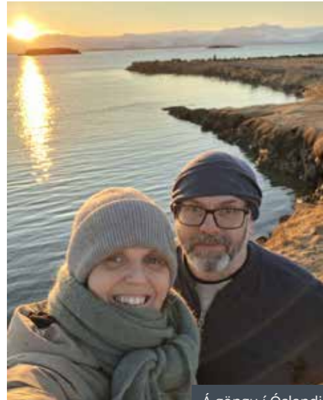
Á göngu í Óslandi

Forsíðumyndin að þessu sinni sýnir um 160 seli sem flatmaga á sandrifi við Akurey í Hornafirði. Myndina tók Sidda Árni, sem margir þekkja fyrir fallegar myndir héðan úr nærumhverfinu. Hún setti í samhengi ýmislegt sem ég hef verið að velta fyrir mér undanfarið.