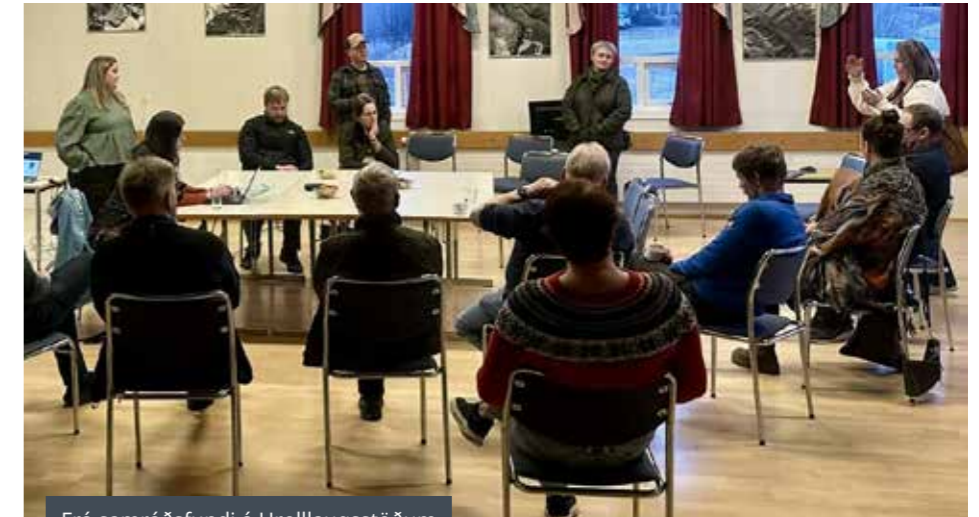
Frá samráðsfundi á Hrollaugsstöðum

Samanlagt mættu rúmlega 60 manns á fundina sem haldnir voru á Hrollaugsstöðum og í Nýheimum, ásamt því að vera sóttir í streymi.