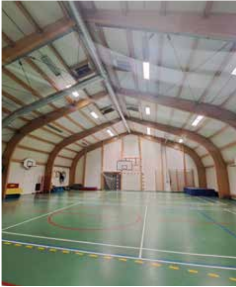
Mynd: Íþróttahúsið á Bildudal, en þar búa um 250 manns. Sambærileg bygging myndi gagnast Öræfingum vel en íbúatala er þýsna svipuð.

Sveitarfélagið Hornafjörður er víðfemt, hér eru mörg tækifæri en uppbygging sveitarfélagsins hefur ekki verið í takt við atvinnuþróun og fjölgun íbúa í Öræfum. Í Öræfum hefur íbúafjölgun innan sveitarfélagsins hlutfallslega verið mest, árið 1998 voru hér 109 íbúar en árið 2022 vorum við 228, þá eru ótalin þau sem búa hér en hafa ekki skráð lögheimili sitt í pósnúmerið. Samhliða þessu hafa milli 15-20 hús verið byggð hér á síðustu 7 árum. Ungt fólk hefur flust aftur heim og nýir Öræfingar hafa orðið til þegar aðkomufólk hefur sest hér að. Öll þessi uppbygging og íbúafjölgun sýnir það að hér vill fólk búa.