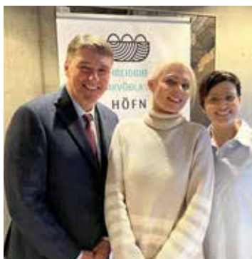
Frá undirritun samstarfssamnings um Hreiðrið Frumkvöðlasetur á Höfn

Sveitarfélagið Hornafjörður hefur boðið upp á aðstöðu fyrir aðila sem starfa án staðsetningar um árabil og er sú aðstaða einnig