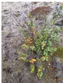
Mynd 2: Birkiplanta sem að hluta til er þakin laufi