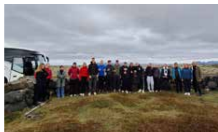
Mynd 4: Hópurinn sem fór í ferðina