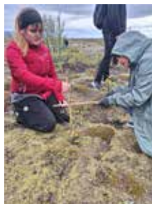
Mynd 3: Birkiplanta mæld í reit 4