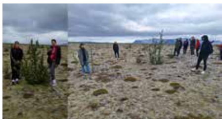
Mynd 1: Birkiplanta 2 í reit 3 á Skeiðarársandi frá árinu 2014 og 2023.