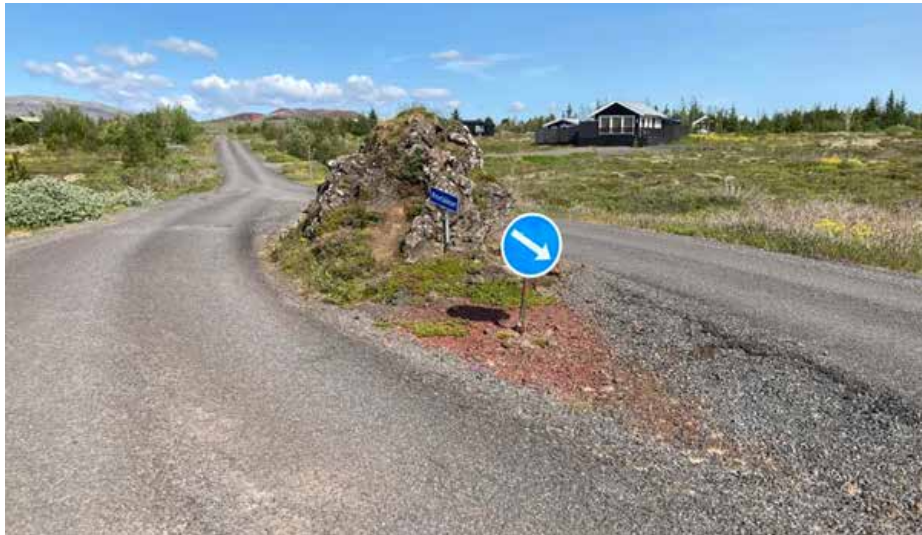
Hér var ekki sprengt með dínamíti, heldur fundin lausn. Allir sáttir, ferðamenn, álfa, tröll, leiðsögumenn, framkvæmdaraðilar og aðrir hagaðilar. Virðing er lykilorðið!

Þegar umræðan um Toppból var í hámarki, var ég staddur í sumarbústaðalandi í Álfasteinssundi í Grímsnesi og þar er steinn, Þorlákur heitir hann eftir tröllkarli sem varð að steini þegar sólin kom upp. Vegagerðarmenn fundu sniðuga lausn, lögðu veg er beggja vegna Þorláks og virðist hann vera nokkuð sáttur og sagan lifir. Hornfirðingar höfðu gæfu að bjarga vatnstanknum á Fiskhól frá niðurrifi á síðustu öld og er hann orðinn tákn fyrir staðinn. Ekki er hægt að bjarga Toppból með þessari sniðugu lausn.