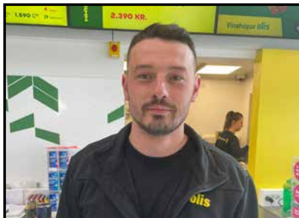
Ramiz Visoka Við vitum það ekki, það er hvergi skrifað í neitt trúarit