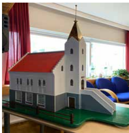
Bjarnaneskirkja eftir Ragnar Imsland

Almenn ánægja var með kirkjuna en fljótlega fór að bera á stórfelldum smíðagöllum. Steypan í kirkjunni var vond og auk þess lak turninn. Kirkjan var að mestu leyti endurbyggð á árunum 1922 – 1924. Það var svo árið 1956 að fulltrúi