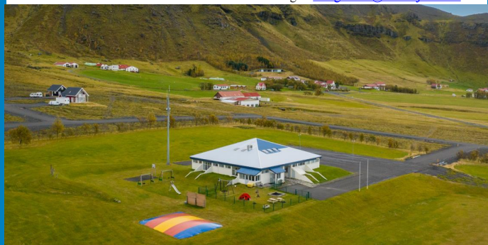
Sveitarfélagið Hornafjörður / Hafnarbraut 27 / S: 4708000 / www.hornafjordur.is