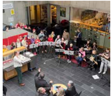
Samverustund í tilefni fjölbreytileikaviku

samfélagi. Menningarmiðstöðin bauð upp á myndatöku fyrir alla sem höfðu áhuga á, teknar voru 150 myndir af allskonar fólki sem eru til sýnis í Nýheimum. FAS stóð fyrir ýmisskonar fræðslu og uppbotum í skólanum og vikan endaði svo á samverustund í Nýheimum þar sem nemendur í 3. bekk upp í 7. bekk sungu lagið Gordjöss við undirleik meðlima úr lúðrasveit Tónskóla Austur-Skaftafellssýslu og gestir gátu gætt sér á kökum og kaffi. Vikan var hin fróðlegasta og fjölbreytileikanum vel fagnað.