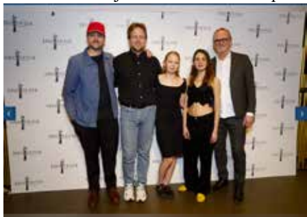
Ljósmynd frá Hlyni Pálmasyni

sem siglir til Íslands og ætlar að byggja þar kirkju og ákveður að ferðast yfir hálandið til að taka myndir af landinu og fólkinu. Hann ræður sér leiðsögumann til að koma honum á áfangastað og saman lenda þeir í ýmisskonar upþákomum. Myndir Hlyns hafa verið teknar upp í Austur-Skaftafelssýslu að langmestu leyti. Volaða land var tekin út um alla sýsluna sem gaf góða innsýn í hvernig aðstæður og andrúmsloft er á svæðinu.