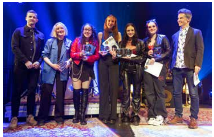
Músíktílaunir. Frá verðlaunaafhendingu