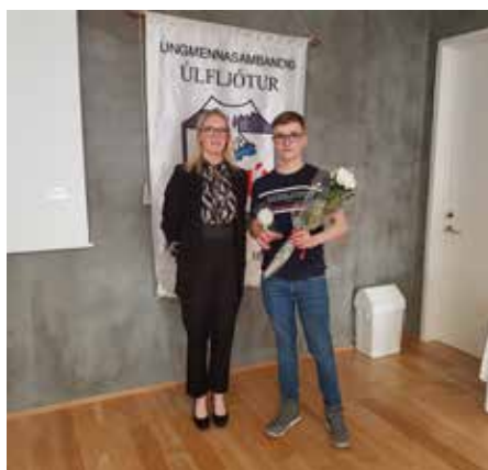
Mynd/ Jóhann Íris Ingólfsdóttir og Friðrik Snær Friðriksson