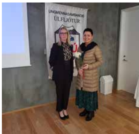
Mynd/ Jóhann Íris Ingólfsdóttir og Hulda Waage