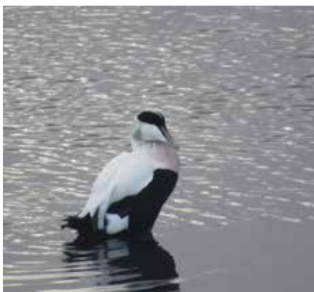
Ljósmynd eftir Kristján Reyni Ívarsson

Kristján stefnir á að verða kokkur eins og staðan er núna. Hver svo sem framtíðin verður er hún björt fyrir þessum efnilega unga manni. Eystrahorn þakkar Kristjáni fyrir spjallið og óskar honum til hamingju með fermingardaginn sem framundan er og að veislugestum hans verði að góðu, þeir eiga sannkallaða veislu í vændum.