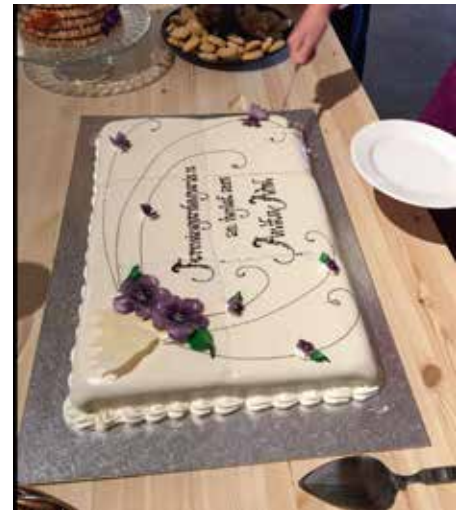
Mynd/fermingakaka úr veislu sem Ólöf Þórhalla hélt.

Að lokum er auðvitað nauðsynlegt að eiga myndir frá þessum dögum og eru nokkrir góðir áhugaljósmyndarar á Höfn