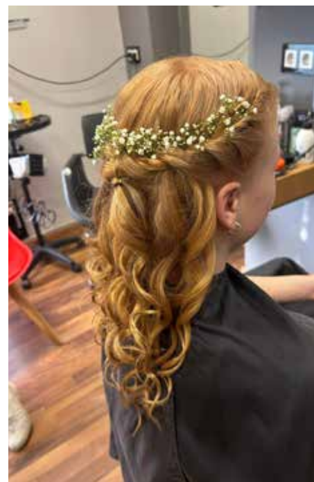
Mynd/ eftir Jónu Margréti Jónsdóttur. Fermingargreiðsla

Vinsælast um þessar mundir er að vera með náttúrulega og einfalda greiðslu. Fallega og léttu liði og hárið tekið frá andlitinu upp í fléttu, snúning eða með einni spennu. Lifandi lítil blóm geta svo sett kirsuberið ofan á rjómann.