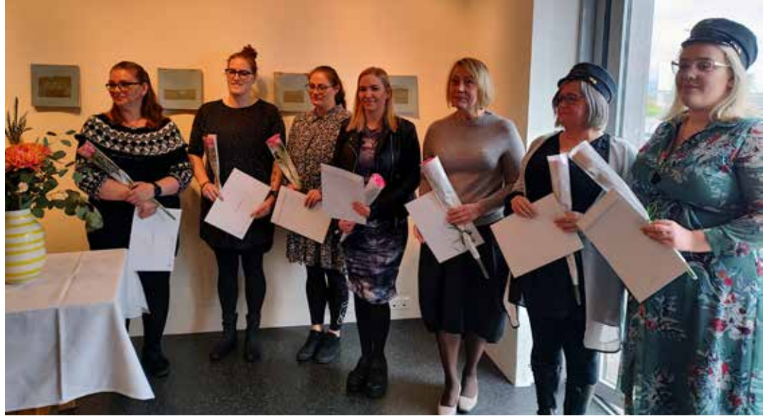
Leikskólaliða- og stuðningsfulltrúar á útskriftardegi í júní 2022

Námið er skipulagt í dreifnámi og í vendikennslu en það felur í sér að námsmenn hafa aðgang að fyrirlesturum sem þeir hlusta á þegar þeim hentar. Einu sinni í viku hittast þeir ásamt leiðbeinenda og ræða efni fyrirlestursins og vinna ýmis verkefni bæði einstaklingslega en líka í hópi. Þátttakendur koma víða að enda nær starfssvæði Fræðslunetsins frá Þorlákshöfn í vestri til Hafnar í Hornafirði í austri. Eins hefur það færst í