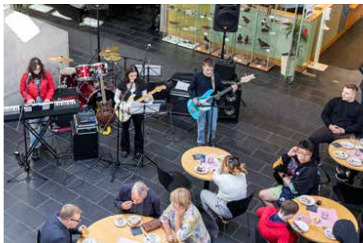
Hljómsveitin Fókus flutti nokkur lög