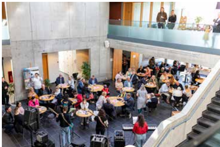
Góð mæting var á hátíðina

Hér má sjá nokkrar myndir frá hátíðinni.