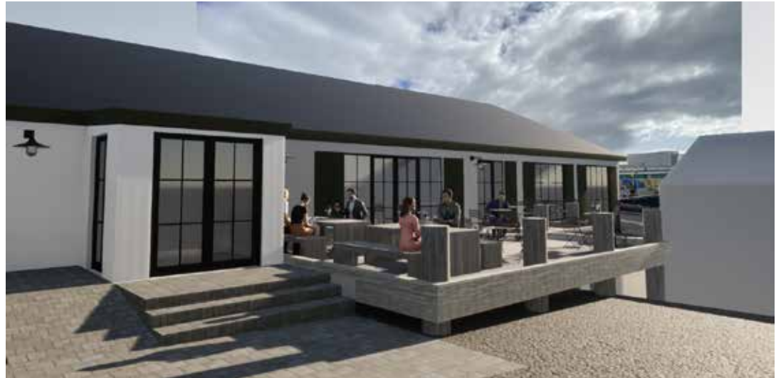
Hér má teikningu hvernig húsið mun lita út að utan

Að sögn eigenda þá er hugmyndin að gera veitingastað sem snýr til vestur út á Heppuna og til suður, sem er með útsýni yfir höfnina. Búið er að saga út fyrir flestum gluggum og hurðum sem eiga að vera á húsinu og við það hafi opnast gríðarlega skemmtilegt útsýni yfir höfnina og útsýnið úr veitingastaðnum er frábært. Við veitingastaðinn verður jafnframt gerður skemmtilegur bryggjupallur vestan við húsið sem tengir húsnæðið við hafnarstemninguna. Inn af veitingarstaðnum verður svo brugghús og verður