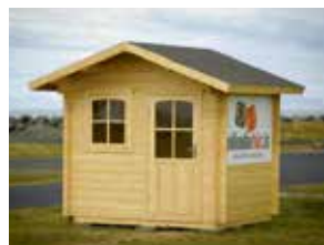
GARÐHÚS 4,7m 2