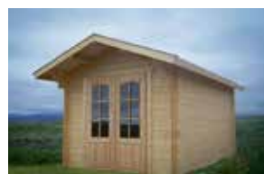
GARÐHÚS 9,7m 2