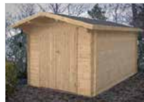
GARÐHÚS 9,9 m 2 án gólfs