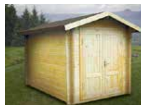
GARÐHÚS 4,4m 2

Sjá fleiri GESTAHÚS og GARÐHÚS á tilboði á heimasíðunni volundarhus.is