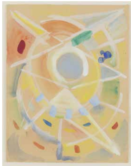
Þessi vatnslitamynd verður meðal þeirra sem verður til sýnis á Hreyfingu í föstum formum.