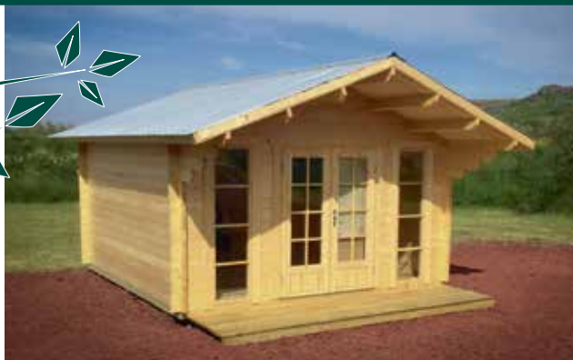
44 mm bjálki / Tvöföld nótun