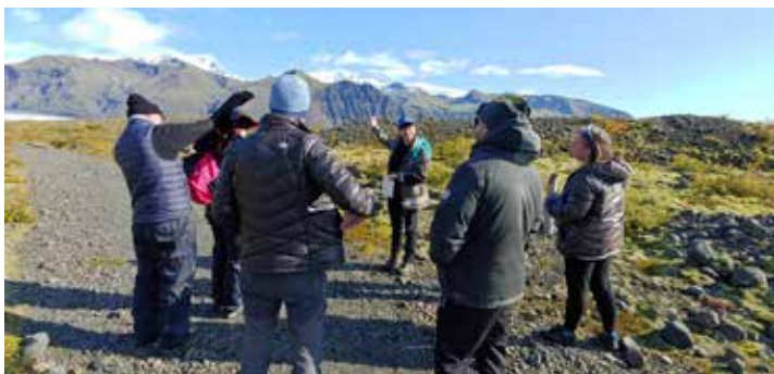
Fræðsluganga í Skaftafelli