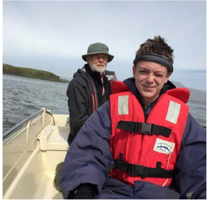
Fjölskylduvinir í eyjaferð

Ég er frjálss hérna á Höfn. Ég er að fara út og gera eitthvað. Ég er að keyra og vinna. Ég má gera miklu meira hérna á Íslandi en ég má í Ameríku. Námið er öðruvísi. Hérna ég er í framhaldsskóla sem er College í Ameríku. Ég má ráða hvað ég vil taka. Það er engin fast food hérna á Höfn eins og það er í Ameríku. Ég er að tala um Panda Express, McDonalds, eða Taco Bell. Ég sakna þess stundum en það er betur fyrir mig. Ég var að borða of mikið fast food.