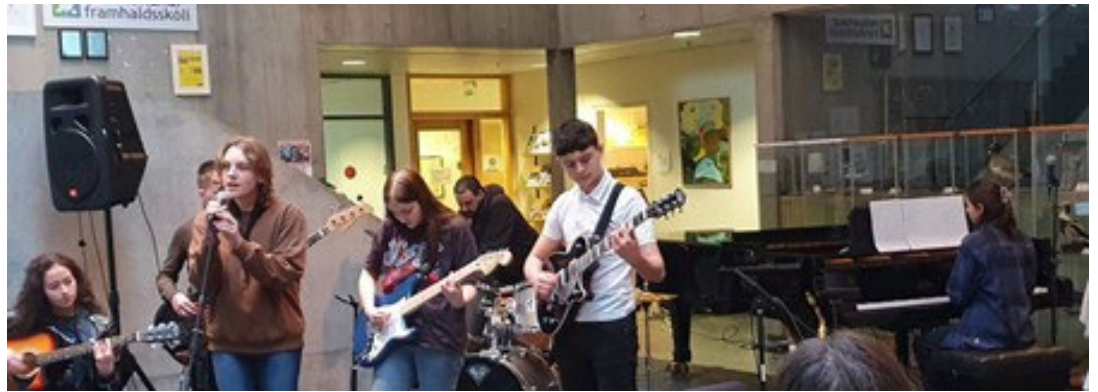
Hornfirski hljómsveitin Lubbarfir spiluðu fyrir gesti