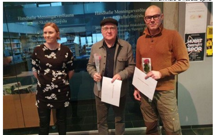
Barnastarf Hafnarkirkju og Skotveiðifélagið hlutu styrki frá Fræðslu- og tómstundaneftar