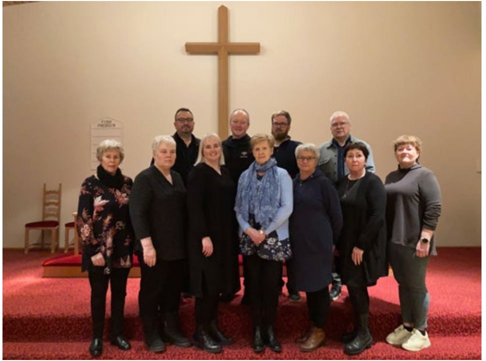
Fulltrúar Hirðingjanna, karlakórsins og sóknarnefndarinnar

Eins og staðan er í dag hafa um 30 einstaklingar lagt inn á styrktarreikninginn um 700.000- kr., í misháum upphæðum eins og gengur og gerist, og þar af nokkrum rausnarlegum. Jafnframt hafa Hirðingjarnir fært kirkjunni hvorki meira né minna en 1.000.000- kr. styrk. Jólatónleikar karlakórsins voru með óhefðbundnu sniði fyrir jól og eingöngu sendir út á netinu. Fólki voru gefnir möguleikar á frjálsum framlögum í tengslum við tónleikana og ákvað karlakórinn að afhenda kirkjunni ágóðann, 138.000 kr. Það er notalegt að finna að fólki er greinilega ekki sama um kirkjurnar okkar og þessi viðtæki stuðningur ber vitni um góðan hug íbúanna. Sama má segja um brottflutta Hornfirðinga sem lögðu verulegt framlag í söfnunina.