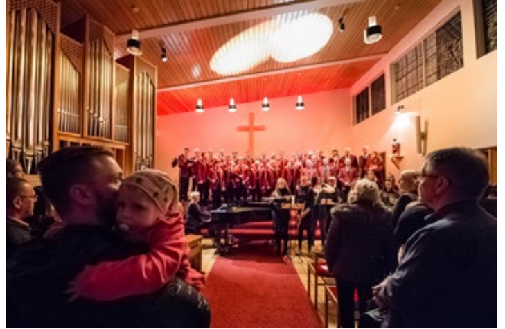
Frá jólatónleikum karlakórsins 2016.

Þau sem vilja styrkja gott málefni geta borgað upphæð að eigin vali á reikning 0169-26-1510 kt:610280-0139