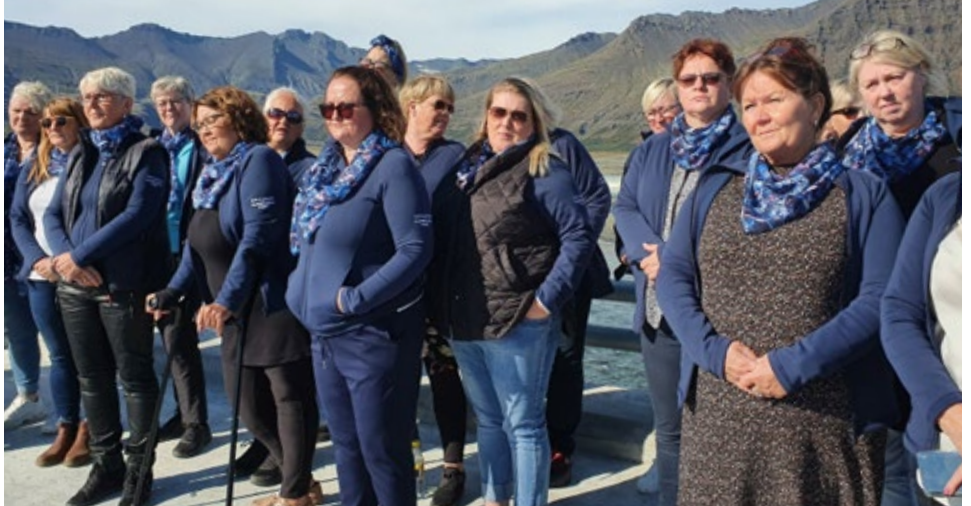
Kvennakór Hornafjarðar tók lagið en hann hefur vakið athygli á að fækka þarf einbreiðum brúm í Sveitarfélaginu.