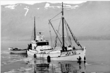
Helgi SF 50 með góðan afla á Siglufirði.

Tveir komust af, er Helgi frá Hornafirði fórst Sá hörmulegi atburður varð um hádegisbil á föstudaginn 15. september 1961, að vélbáturinn Helgi SF-50 frá Hornafirði fórst í ofsaveðri skammt vestur af Færeyjum og með honum sjó ungir menn, sá elzti um fertugt. Tveir af áhöfninni komust af og var þeim bjargað um borð í skozkan fiskibát eftir að þá hafði hrakið fyrir sjó og vindi í gúmmibát í tæpan sólarhring. Það var ekki fyrr en í gærmorgun, að vitnaðist um slysið.