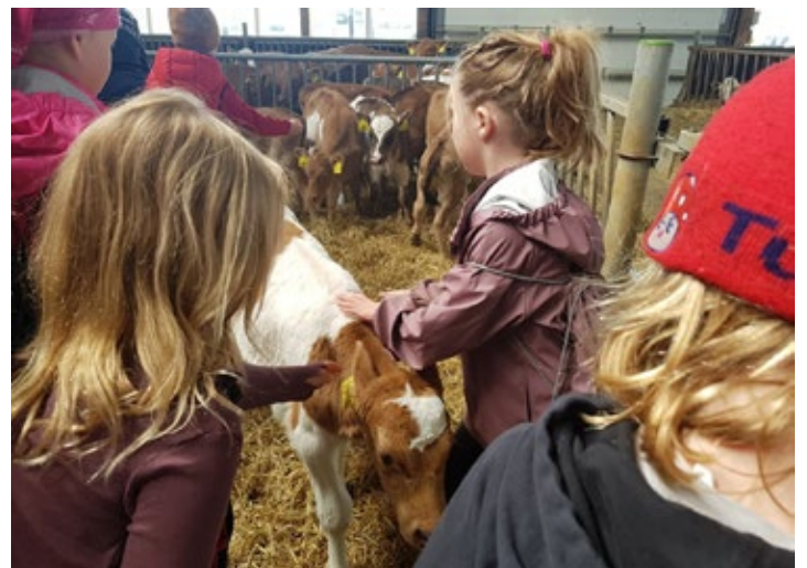
Kíkt var í Flatey og fengu börnin að skoða kýrnar

Starfsfólk Menningarmiðstöðvarinnar þakkar öllum þeim sem tóku þátt í ferðunum og öllum þeim sem lögðu lið. Svona starf