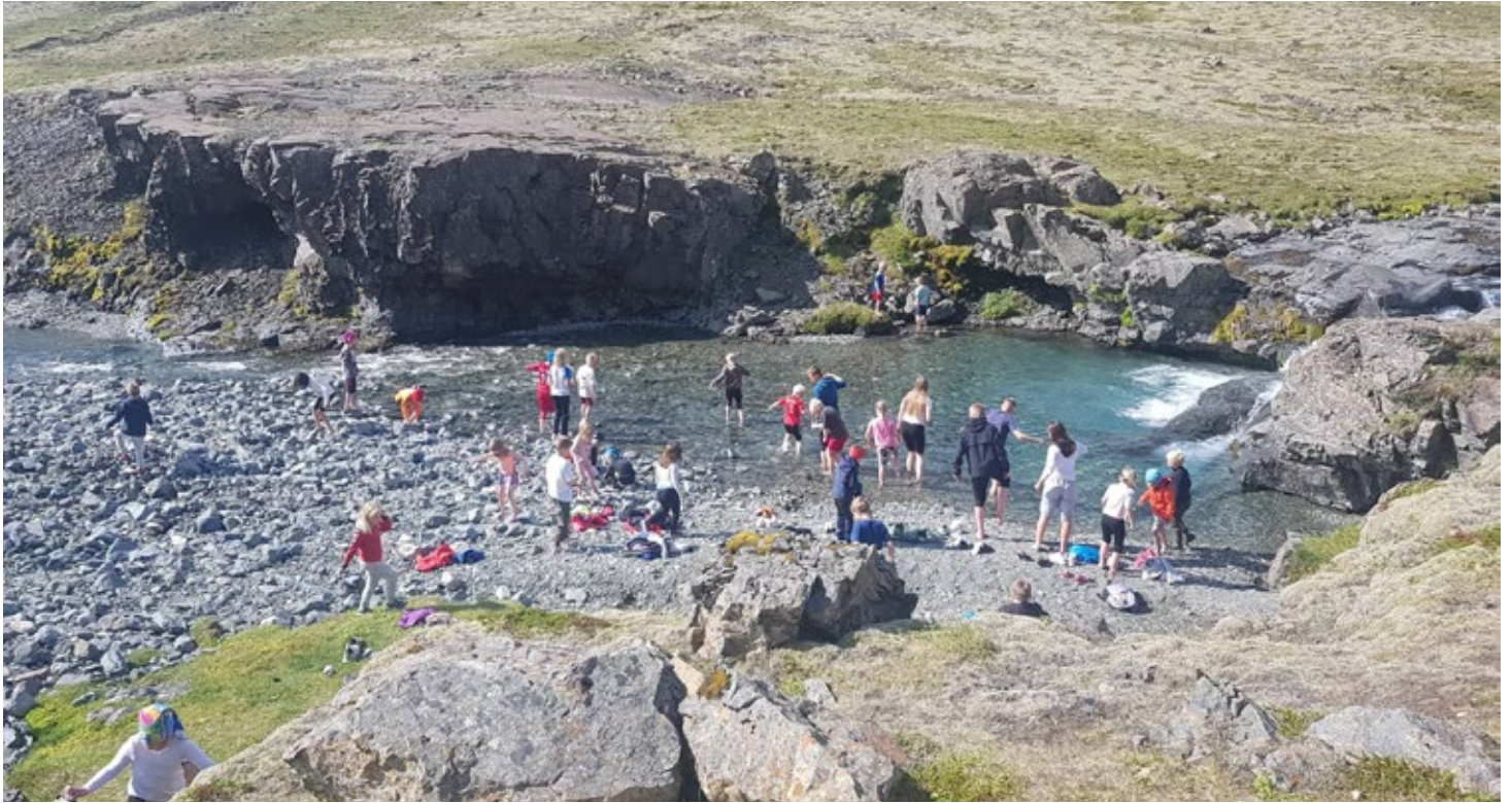
Krakkarnir fóru í blíðskaparveðri inn að Þorgeirsstaðarfossi og léku sér í ánni

Hefð er fyrir því að Menningarmiðstöð Hornafjarðar standi fyrir fræðslu og skemmtiferðum fyrir börn frá sjö ára aldri. Í sumar var þar engin breyting á og voru farnar tíu ferðir, tvær þeirra voru farnar í samstarfi við leikjanámskeið Sindra og gekk það vonum framur og mættu þá um 60 börn í ferðirnar, annars eru vanalega um 15 börn að meðaltali í ferðum miðstöðvarinnar.