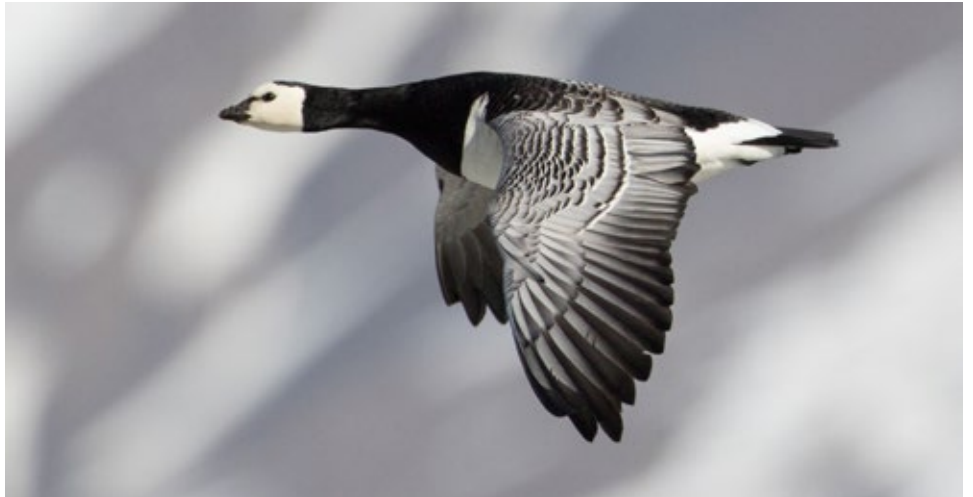
Helsingi á flugi.

Helsingjanef eru krabbadýr, þótt þau minni raunar lítið á krabba við fyrstu sýn. Þau teljast til þess ættbálks krabbadýra, sem hlotið hefur nafnið Cirripedia, en á íslensku hafa slík dýr verið nefnd skelskiúfar. Svo virðist sem Benedikt Gröndal sé höfundur íslenskra nafnsins. Að minnsta kosti virðist það hvergi koma fyrir á prenti fyrr en í 5. hefti af Gefn, en það er tímarit, sem Gröndal gaf út meðan hann dvaldi í Kaupmannahöfn. Fimmta og síðasta hefti þessa tímarits, sem kom út árið 1874, fjallar einvörðungu um náttúru Íslands. Þar er allmikið af