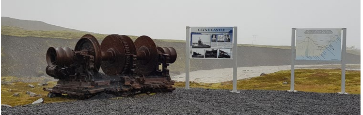
Spilið úr botnvörpunum Clyne Castle er nú komið upp við söguskiltin sem standa við áningastað vestan við Kvía