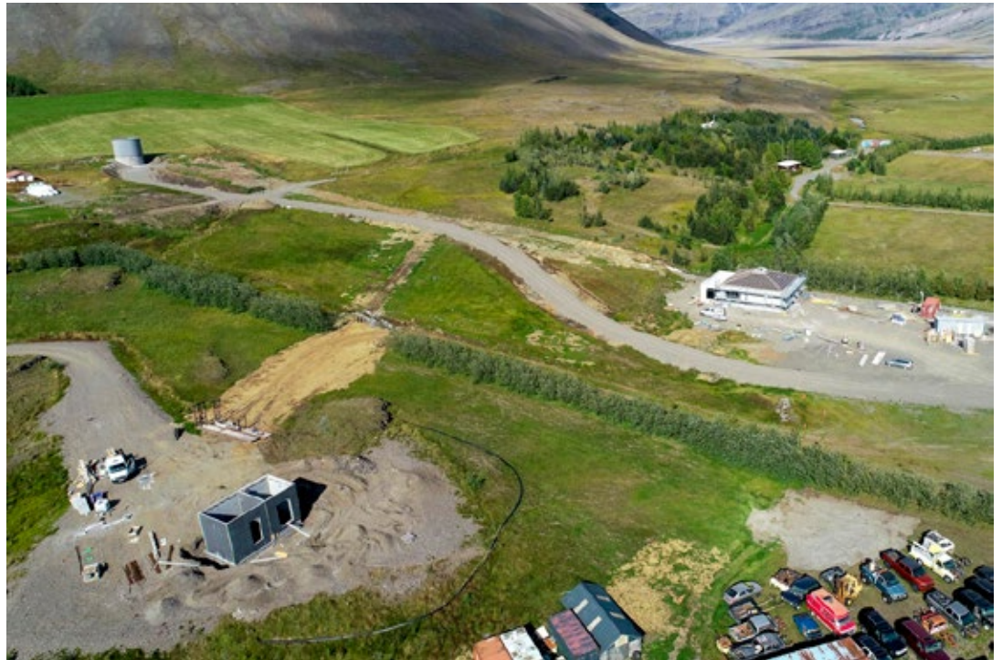
Loftmynd frá Hoffelli sem sýnir tank veitunnar efst til vinstri, dælustöð hægra megin og borholuhús neðst til hægri.

RARIK stefnir að því að tengja nýju stofnlögnina við dreifikerfi veitunnar á Höfn síðar í haust, en þá munu allir sem nú eru tengdir fjarvarmaveitunni tengjast borholusvæðinu við Hoffell og á sama tíma munu nýir notendur í Nesjum, þar á meðal í Nesjahverfi, tengjast veitunni.