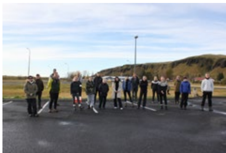
Íslensku þátttakendurnir í Geoh heritage verkefninu.

nemenda sem voru á staðnum og svo til annarra þátttakenda í gegnum streymi. Þessi tilraun gekk bærilega þó vissulega hafi verið einhverjir hnökror eins og t.d. að netsamband væri ekki nógu stöðugt til að halda úti streymi eins og raunin varð í Lakagígum. Í þessari ferð var líka markvisst verið að efla staðarvitund nemenda með því að láta þá