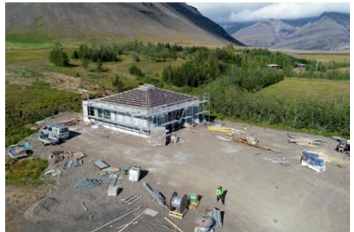
Unnið að byggingu dæluhússins.

Næsta vetur verður haldið áfram að tengja einstaka fasteignir sem liggja við núverandi dreifikerfi veitunnar. RARIK mun fljótlega bjóða út lagningu nýrra stofnlagna dreifikerfisins í Vesturbraut og Silfurbraut og er áætlað að framkvæmdir við þær geti hafist snemma næsta vor. Nýir notendur við þessar götur munu í framhaldinu tengjast dreifikerfi veitunnar.