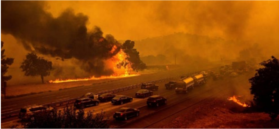
Miklir skógareldar eru í Kaliforníu og fylgir því mikil loftmengun