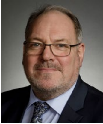
Hlutdeildarlán hitta í mark.

Afkastamikill þingstubbur var haldinn í síðustu viku og voru þau mál klárud sem gert hafði verið ráð fyrir á stubbnum og reyndar rúmlega það. Þingstarfið er óhefðbundið í þeim kringumstæðum sem við erum að glíma við sem þjóð og við höfum verið að afgreiða mál í þinginu sem taka mið af breyttum aðstæðum. Þær breytast frá degi til dags en það er gengið vasklega fram og viðbrögðin og aðgerðirnar flestar mælst vel fyrir og virkað vel. Eðlilega ekki allar aðgerðirnar en ríkisstjórnin hefur fylgt því að gera frekar meira en minna og almennt er mikil ánægja með það. Umræður og skoðanaskipti í þinginu hafa nær alltaf verið eðlileg en það skortir á skilning á atvinnulífnum sem er meira