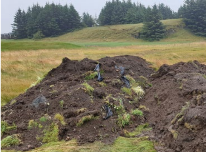
Hér má sjá plasmengaða mold sem var losuð við Hrossabithaga

Að gefnu tilefni vill starfsfólk umhverfis- og skipulagssviðs Sveitarfélagsins Hornafjarðar minna íbúa á að ekki er heimilt að nýta bæjarlandið til þess að losna við úrgang. Töluvert ber á því að múr og steypubrot, full af plasti og járni, séu losuð í Fjárhúsavík. Ekki er heimild fyrir því! Íbúar hafa leyfi til að losa sig við hreinan garðúrgang í Fjárhúsavík en ekkert annað. Sé umgengnin ekki til fyrirmyndar er ekkert annað í stöðuni en að takmarka aðgengi að svæðinu.