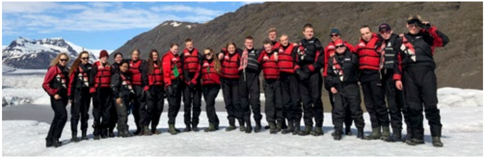
Flottur hópur sem var að ljúka 10. bekk

Daginn eftir byrjuðum við á því að fara í