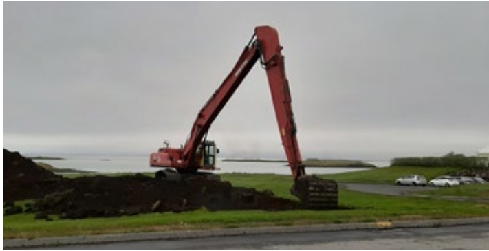
Byrjað var á framkvæmdum þann 13. júní

Nú eru hafnar framkvæmdir vegna byggingar á 8 íbúða raðhúsi.