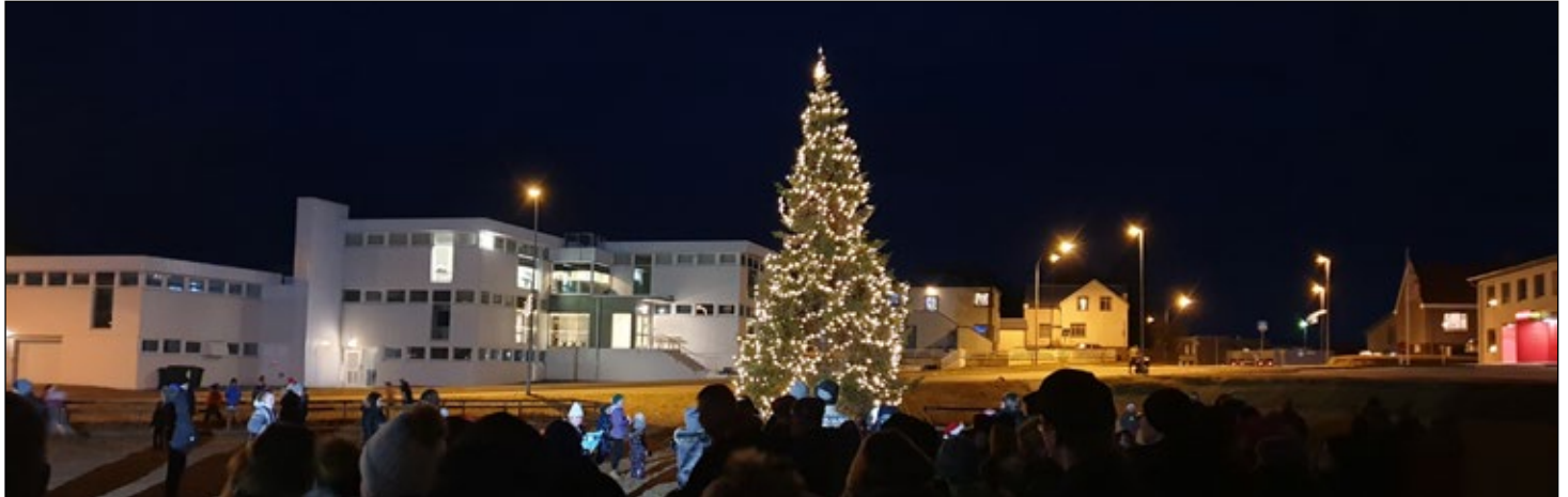
Jólatréð er hið glæsilegasta

Síðastliðinn laugardag var haldin jólahátíð í Nýheimum á vegum Menningarmiðstöðvar Hornafjarðar.