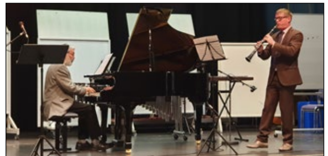
Myndir frá afmælistónleikum Tónskóla A-Skaft.