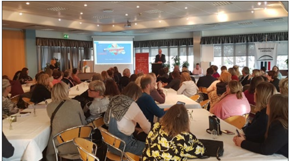
Frá Erasmus+ ráðstefnunni 11. október

FAS var boðið að senda þátttakendur á ráðstefnuna en skólinn hefur á undanförunum árum tekið þátt í fjölmörgum verkefnum sem hafa verið styrkt frá Erasmus+. Fulltrúar af FAS tóku þátt í tveimur málstofum. Annars vegar í málstofu fyrir leik-, grunn- og framhaldsskóla þar sem sérstök áhersla var lögð á skóla á landsbyggðinni sem eru langt í burtu frá alþjóðaflugvelli. Þar var bæði fjallað þau vandamál sem verkefnastjórar úti á landi standa frammi fyrir og eins hve mikla þýðingu það getur