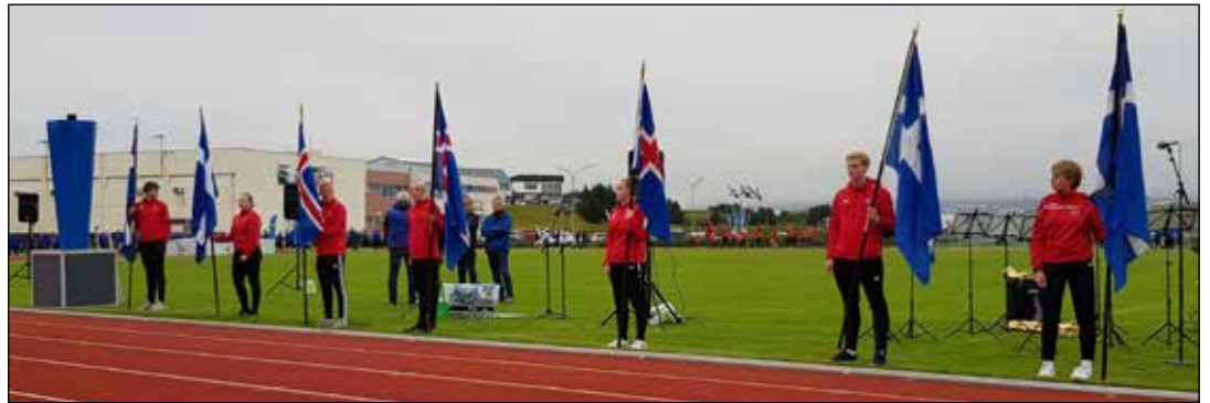
Frá setningu mótsins

Mótið var sett á föstudagskvöldinu með setningarathöfn á Sindravöllum þar sem forseti Íslands og frú voru viðstödd.