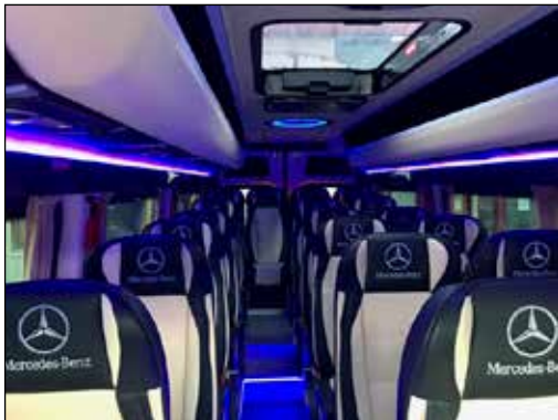
Bíllinn er glæsilegur að innan og engu var til sparað

Keyptir voru tveir nýir bílar til verksins, 2017 Dodge Ram 5500 dráttarbíll með einföldu húsi og Benz Sprinter 519, fullbúinn frá Bus PL í Póllandi, með öllum hugsaðum lúxus fyrir 19 farþega.