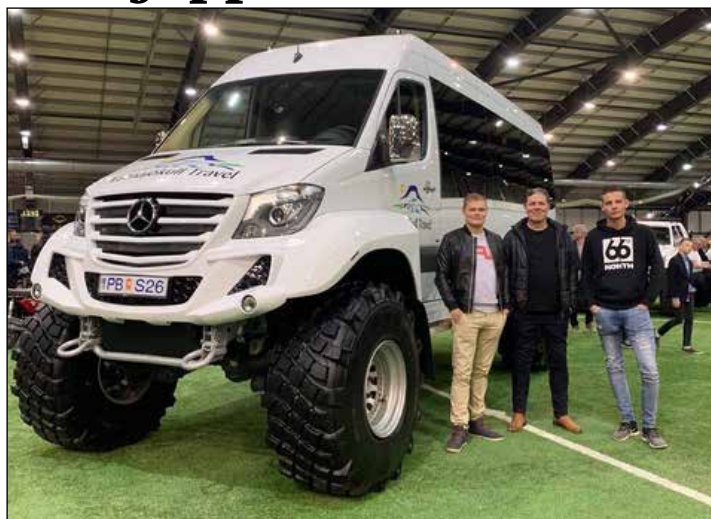
Hér má sjá bílinn fullbúinn á bílasýningu Bílklúbbs Akureyrar í sumar.

burðargetan, styrkurinn og vélaraflið notað frá Raminum, stýrishúsið tekið af og Benz rútan sett ofan á og var þá áður búið að fjarlægja vél og hjólabúnað rúttunnar. Undir bílinn voru settar Unimog herhásingar með úrhleypibúnaði fyrir dekkinn sem geta verið allt að 54 tommur.