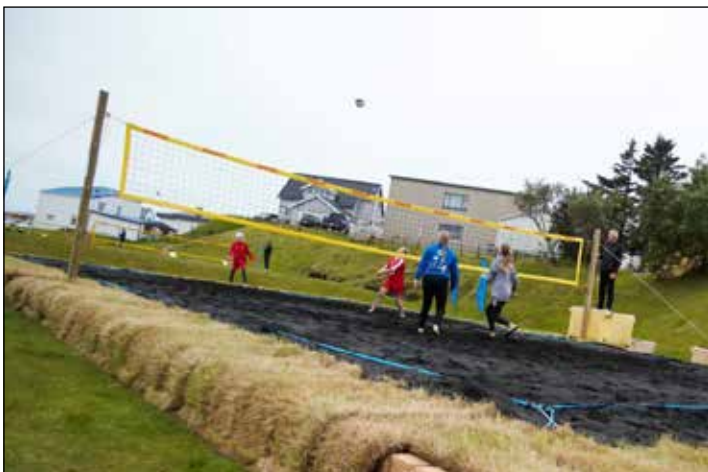
Strandblakið var mjög vinsælt.