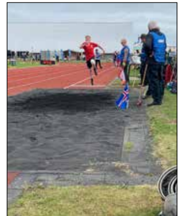
Frá keppni í langstökki

Mótinu var svo slitið á sunnudagskvöldinu af formanni UMFÍ. Formaður USÚ hélt stutt ávarp og gjaldkeri USÚ dró hátíðarfána UMFÍ niður.