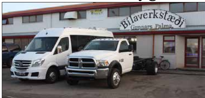
Bílanir tveir sem voru notaðir í verkið