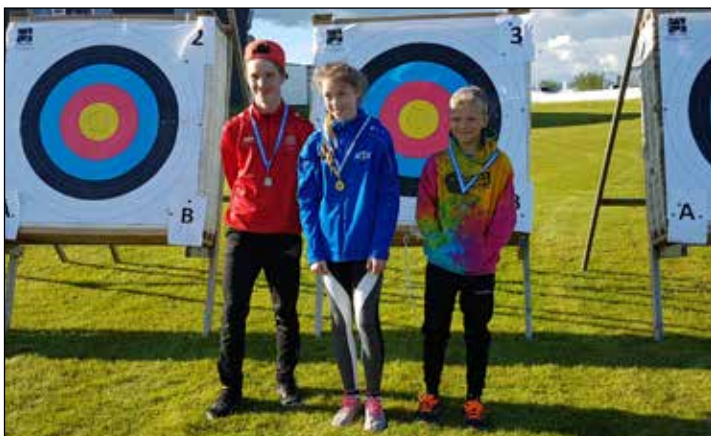
Nokkrir keppendur frá USÚ tóku þátt í bogfimi og stóðu sig vel.

Það hefur vonandi ekki farið framhjá neinum að í ár verður Unglingalandsmót UMFÍ haldið hér á Höfn um Verslunarmannahelgina, dagana 1.-4. ágúst. Unglingalandsmót er eitthvað sem margir hafa farið á en fyrir ykkur sem ekki þekki til þeirra eru þau frábær fjölskylduhátíð með dagskrá og afþreyingu fyrir alla aldurshópa. Það verður hægt að keppa í 21 grein á mótinu og hafa allir keppnisrétt sem eru á aldrinum 11-18 ára, en einnig er margt í boði fyrir 10 ára og yngri þannig að engum á að leiðast þessa helgi. Á heimasíðunni www.ulm.is er hægt að sjá alla dagsskrána og keppnisgreinar á mótinu. Bogfimi, kökuskreytingar, götuhjólreiðar, frísbíggjolf, skottfimi, stafsetning og strandhandbolti eru greinar sem margir eru ekki að æfa dagsdaglega en eru í boði fyrir alla að keppa í á mótinu. Síðan eru greinar eins og frjálssípróttir, körfubolti, fótbolti, sund, motocross, strandblak og fimleikalíf sem eru einnig í boði og geta allir skráð sig í þær. Á hverju kvöldi eru kvöldvökur þar sem fram koma þekktir listamenn og á daginn eru leikjatorg þar sem margt er í boði eins og fótboltapönnu, kubb, skallatennis, brennibolti og stultur ásamt mörgu öðru. Þetta er ekki tæmandi listi um það hvað verður í boði þannig að við hvetjum alla til að kíkja á dagsskrána á www.ulm.is .