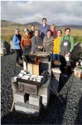
Stelpurnar við ofninn

Auk verka eftir listamennina, sem öll voru unnin sérstaklega fyrir sýninguna, má segja að kjarni hennar sé heimildarmyndin – Raku