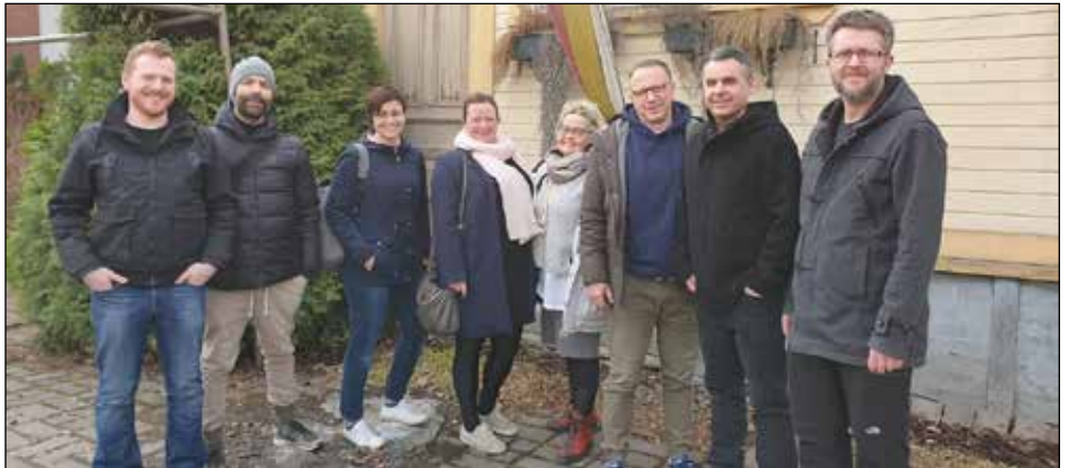
Þátttakendur íslensku sveitarfélaganna í vinnuferð í Salo, Finnlandi vorið 2019

Fjögur íslensk sveitarfélög voru samþykkt í verkefnið, eru það Sveitarfélagið Hornafjörður, Fljótsháherað, Akranes og Mosfellsbær. Einnig taka tólf önnur sveitarfélög þátt frá Svíþjóð, Noregi, Danmörku og Finnlandi. Undirbúningsráðstefna verkefnisins var haldin í Osló í Noregi í september 2017. Þar komu saman fulltrúar allra þátttökusveitarfélaganna til að hefja vegferðina og stilla saman strengi fyrir næstu tvö árin. Sveitarfélögunum sextán var skipt í fjóra hópa þar sem tekið var mið af þeim áskorunum og tækifærum sem