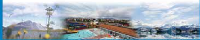
Sveitarfélagið Hornafjörður / Hafnarbraut 27 / S. 4708000 / www.hornafjordur.is