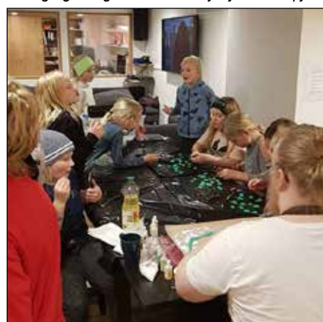
Brjóstsykursmolagerðin sló í gegn

Valið var í Þrykkjuráð sem kemur saman einu sinni í viku og ákveður hvað skal gera í Þrykkjunni svo hjálpum við þeim að koma