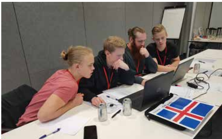
Einbeitt lið í olíuleit

Hægt er að nálgast blaðið og eldri blöð á www.eystrahorn.is