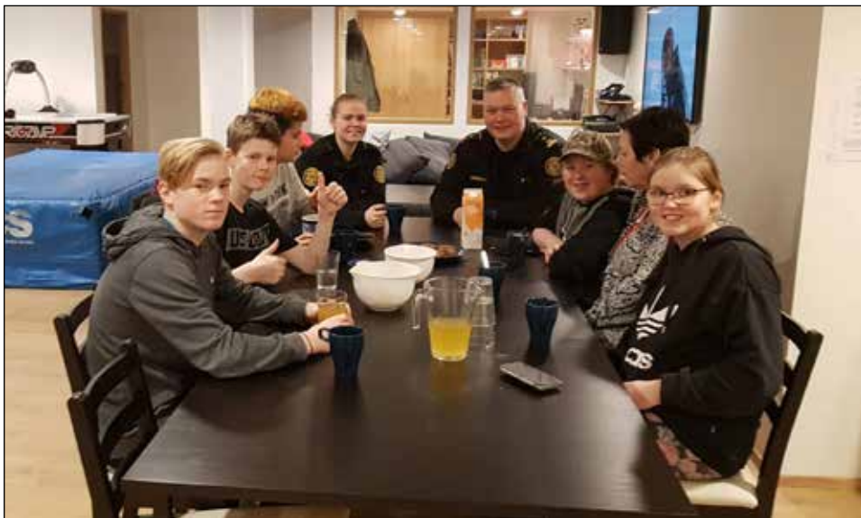
Lögreglan og krakkarnir í Þrykkjunni að spjalla

Löggan kom sterk inn í að kenna borðtennis og ýmis trix í uppgjöf. Einnig spiluðum við við lögguna í Rallýspilinu og fleira skemmtilegt. Lögreglan er alltaf velkominn í te og kaffi en þar eru allir sterkir á velli. Hellum upp á kaffi, kakó og blöndum okkur djús, spjöllum