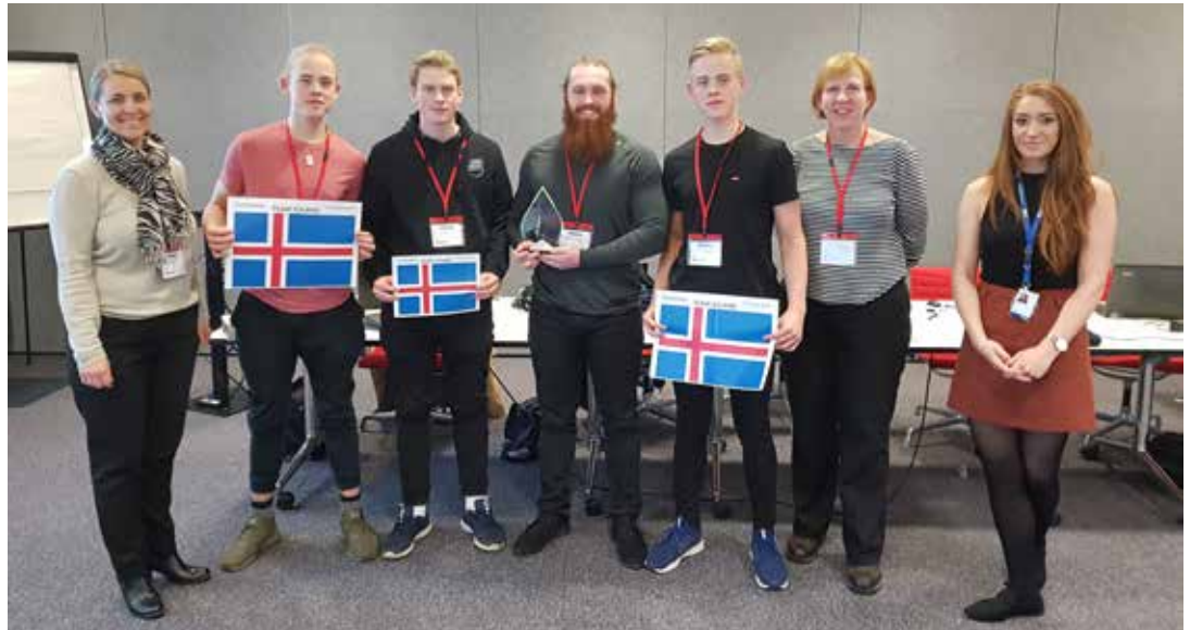
Sigurinn í höfn.

Lokakeppnin fór fram föstudaginn 25. janúar í Schlumberger Cambridge Research (SCR) en það er fyrirtæki sem sérhæfir sig m.a. í tæknilausnum fyrir olíuindnað. SCR er með starfsemi í 85 löndum og hjá fyrirtækinu starfa um 100.000 manns af rúmlega 140 þjóðernum í alls konar fyrirtækjum. Eitt fyrirtækjanna er Next sem er hugbúnaðarfyrirtæki og hannar m.a. olíuleitarleikinn. Auk þess að hýsa keppnina vill SCR kynna starfsemina og um leið benda ungu fólki á möguleg störf í framtíðinni. Á lokakeppnina var einnig mætt liðið sem sigraði í landskeppninni í Noregi auk nokkurra norskra