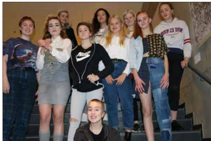
Allir þátttakendur í undankeppninni