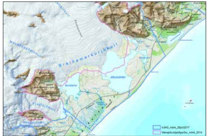
Kortið sýnir svæðið sem vinnan við stjórnunar- og verndaráætlun nær yfir. Blá lína: Mörk Vatnajökulsþjóðgarðs eftir stækkun 25. júlí 2017. Bleik lína: Þjóðgarðsmörkin fram til 25. júlí 2017.