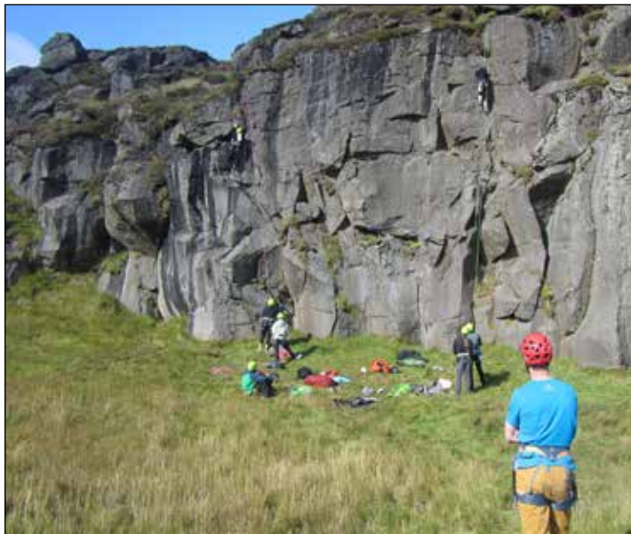
Árni kennari fer yfir notkun bergtrygginga í Klettklifri 2.

Sigurður Ragnarsson Kennari í fjallamennskunámi FAS