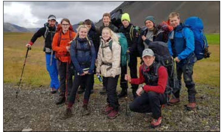
Nemendur og kennarar við upphaf Gönguferðar 1.

Færa þurfti eitt námskeið frá september yfir í október, sem gerði það að verkum að þrjú námskeið