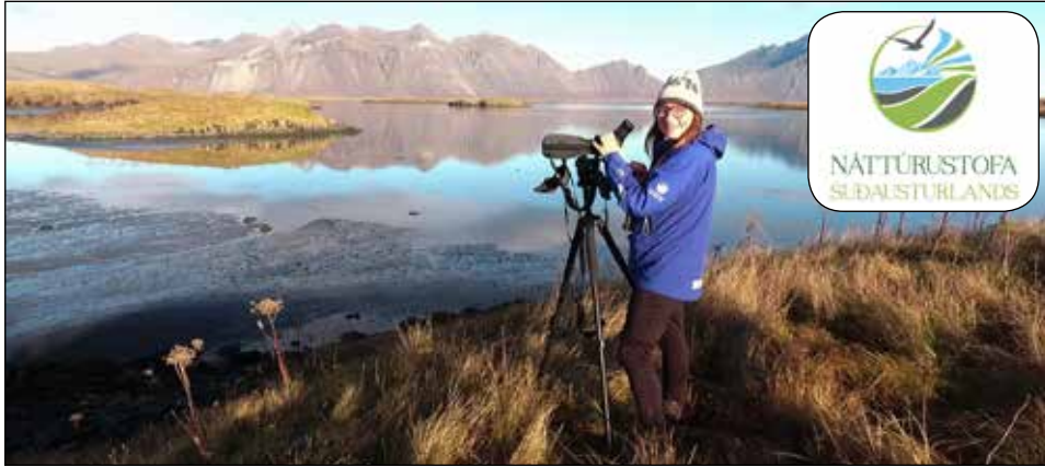
Lilja við talningar úr Standey en til verksins eru notuð öflug fjarsjá og sjónauki.