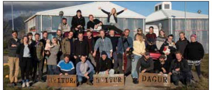
Leikarar og tökulið fyrir Hvítur, hvítur dagur