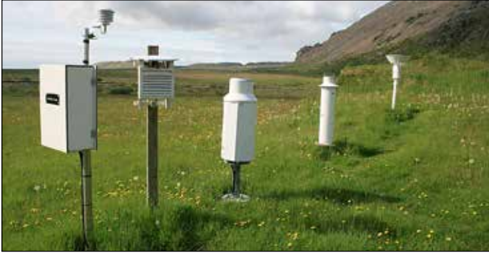
Kvisker í Oræfum. Hér sjást þrjár tegundir úrkomumæla: hefðbundinn, gamall úrkomusírti og afbrigðilegur sjálfvirkur vigtarmælir. Myndin er tekin 2. júlí 2009.

Unnin hefur verið skýrsla um veðurfar á Suðurlandi frá árinu 2008 til 2017 af Veðurstofu Íslands fyrir Samtök sunnlestra sveitarfélaga (SASS).