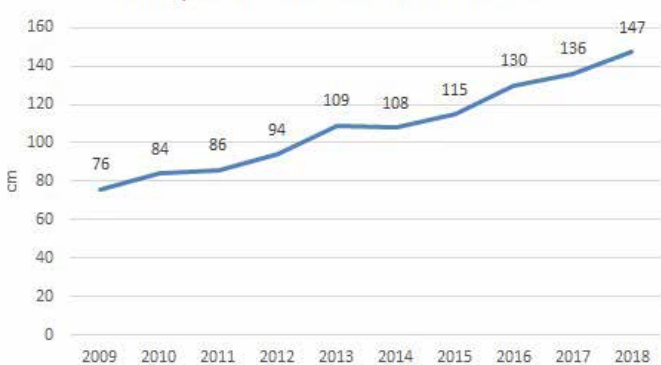
Hæð plöntu 6 í reit 4 frá 2009 - 2018

Mælingar á hæð einnar plöntu á Skeiðarársandi, árin 2009-2018. Hún hefur hækkað um 71 cm á 10 árum, eða 7,1 cm á ári.