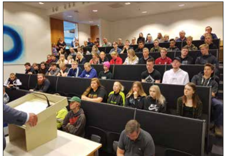
Skólasetning í FAS

það hefur verið ákveðið að halda þessum sameiginlegum stundum áfram og var fyrsta boði í boði Frumkvöðlagangs síðastliðinn þriðjudag. Borðin svignuðu undan kræsingum sem runnu ljúflega í maga. Við þetta tækifæri kynnti Eyjólfur