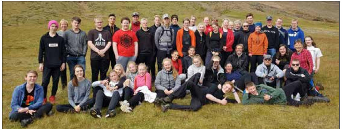
Hópurinn sem fór í nýnemaferðina

Skólastarf haustannar í FAS hófst þann 20. ágúst með skólasetningu. Í kjölfarið voru svo umsjónarfundir þar sem nemendur skoðuðu stundatöflur sínar og skipulag annarinnar nánar. Kennsla hófst svo þriðjudaginn 21. ágúst samkvæmt stundaskrá. Farið var miðvikudaginn 22. ágúst í nýnemaferð. Það var föngulegur hópur sem lagði af stað í rútu og samanstóð hópurinn bæði af nemendum og kennurum. Ferðinni var heitið inn að Lindabakka en búið var að ákveða að ganga þaðan upp Krossbæjarskarð og yfir að réttinni í Laxárdal. Tilgangur ferðarinnar var fyrst og fremst að bjóða nýnema velkomna í skólann. Á gönguferð sem þessari geta nemendur bæði eldri og yngri og svo kennarar blandað geði og kynnst á öðrum vettvangi en í skólastofunni. Ekki spillti fyrir að veður var ljómandi