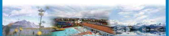
Sveitarfélagið Hornafjörður / Hafnarbraut 27 / S: 4708000 / www.hornafjordur.is

Einnig er hægt að nálgast netföng starfsfólks á heimasíðu sveitarfélagsins http://www.hornafjordur.is/stjornsysla/sveitarfelagid/starfsfolk/