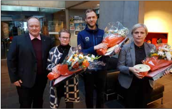
Handhafar umhverfisviðurkenninga 2017

Umhverfisnefnd auglýsir eftir tilnefningum til umhverfisviðurkenningar 2018.