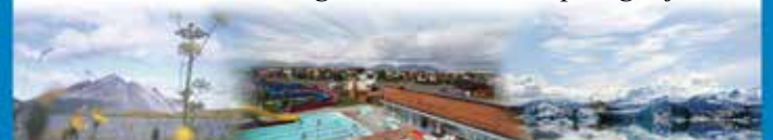
Sveitarfélagið Hornafjörður / Hafnarbraut 27 / S: 4708000 / www.hornafjordur.is