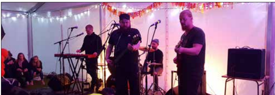
Hornfirskir tónlistarmenn héldu uppi fjörinu í Heimatjaldinu