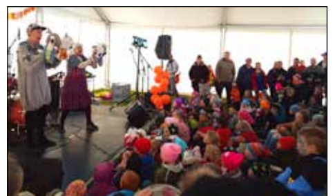
Leikhópurinn Lotta skemmti börnunum