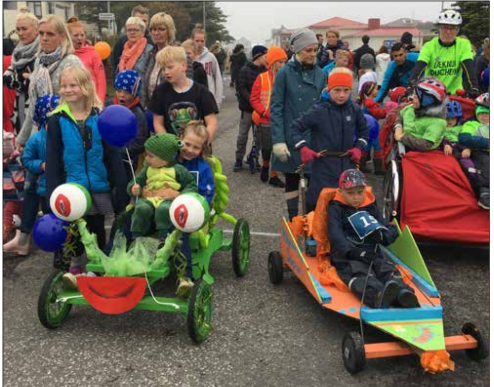
Metþátttaka var í Kassabílarally Landsbankans þetta árið

Hátíð sem þessa er ekki hægt að halda án hjálpar frá styrktaraðilum og sjálfboðaliðum og vill nefndin nota tækifærið og þakka öllum þeim sem lögðu hönd á plóg fyrir sitt framlag. Margt smátt gerir eitt stórt og það sannaðist